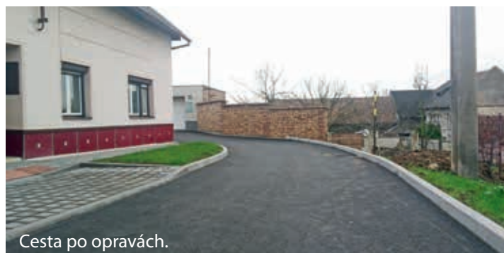
Cesta po opravách.