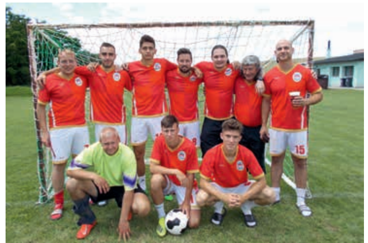
Vítězný tým FC Liverpool