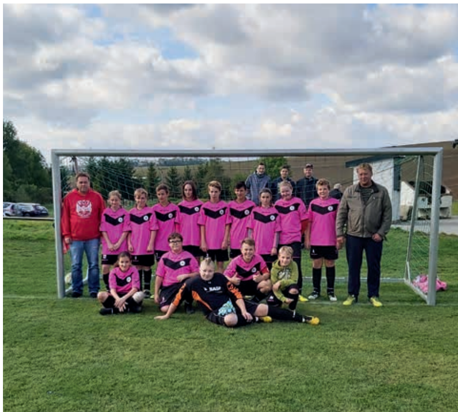
Tým starších žáků dřínovských fotbalistů hledá nové posily, jinak bude muset skončit. Více na zadní straně.