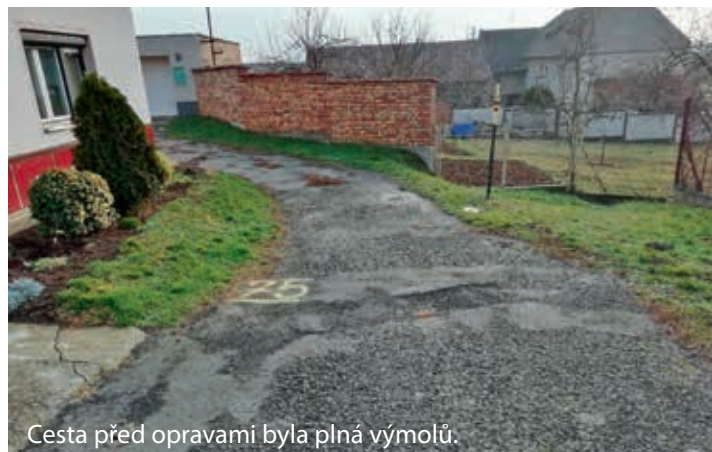
Cesta před opravami byla plná výmolů.